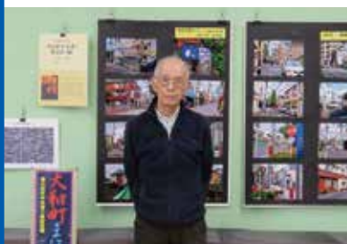
大和ギャラリーでの「大和町まほろば」展

「大和町まほろば」には、中央通り拡幅前の写真がたくさん載せられています。また、「大和町まほろば」(意味/大和町は優れた良い所)のタイトルで、大和町中央通り商店街が「大和ギャラリー」で展示され、街並みと人々の楽しそうな様子が紹介されていました。 大和町はこれからも進化し続けます。石川さんが撮り続ける「大和町まほろば」の第3回目を、楽しみにしています。