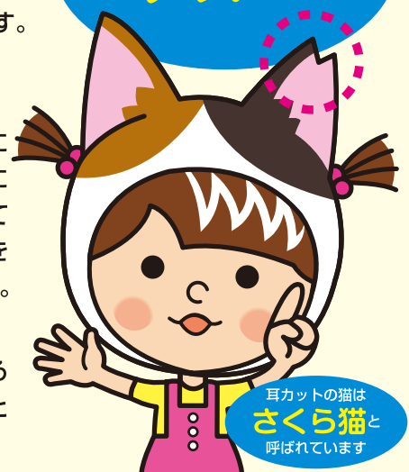
耳カットの猫は さくら猫 と 呼ばれています