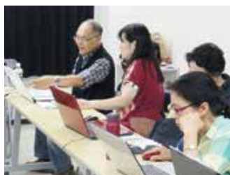
「大和パソコンクラブ」での授業