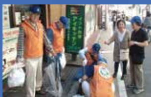
クリーンキャンペーン

他に『クリーンキャンペーン』『なかのエコフェア』などのボランティア活動にも参加しています。いかがです?あなたも人生キャリアを活かして、我々と一緒に活動しませんか。