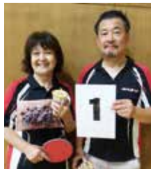
B グループ優勝 宮・大野ペア