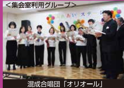
混成合唱団「オリオール」

TEL/03-3339-6125 FAX/03-3339-6126 集会室予約/03-3339-6141 Email/nakano_yamato@coast.ocn.ne.jp