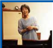
ランチタイムコンサートの トークタイム。