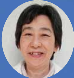
大和西見児童館 館長・キッズプラザ美鳩 所長

新年度を迎え、皆さんの暮らしに関わりの深い施設で、人事異動がありました。これから、私たちとお付き合いが始まる方々から、メッセージをいただきました。