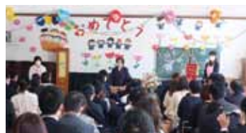
大和幼稚園の入園式