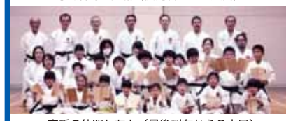
空手の仲間たちと(最後列左から3人目)

67号まで続いている「瓦版 Yamato 東町会」が活かされている「瓦版」は、楽しくためになる町会情報誌です。