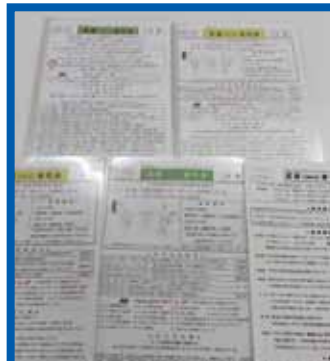
67号まで続いている「瓦版 Yamato 東町会」