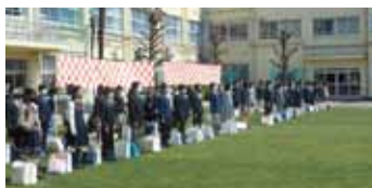
啓明小学校の卒業式