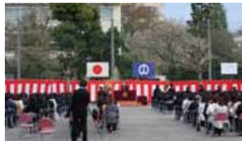
明和中学校の入学式