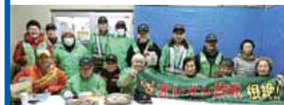
町会活動に参加(後列右から4人目)