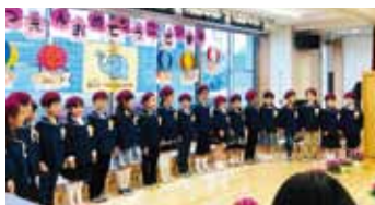
田中ナースリー大和保育園の卒園式

●8か所の保育園と2か所の幼稚園の卒園児は、合計約210名、新入園児は約220名。子供たちの笑顔は満開でした。