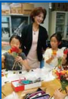
クラブで教える子供たちと