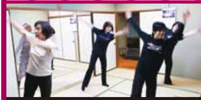
みんな楽しくリズムストレッチ