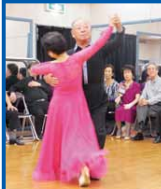
毎回“トリ”を務める大関さん