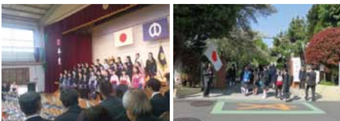
啓明小学校卒業式

去年の新入学生は、啓明小50名・美鳩小119名・四中91名でした。3校とも去年の新入学生数を上回ったことは、嬉しい限りですね。