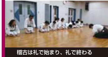
稽古は礼で始まり、礼で終わる

と育てたいことを聞きました。「私は強さを求めるより健康法を第一に指導しています。会員さんの年齢が、下は小学校2年生から上は73歳の女性と幅が広いので、子供には大人に対する礼儀を、大人には子供への思いやりを育てたいと思っています。」このクラブには女の子も含めて女性が7名、親子で3組が参加しています。子供たちは「楽しい!体が丈夫になった」「苦手だった運動が出来るようになった」お母さんたちは「最初は護身術のつもりだったけど、今は子供と同じ目線で考えられるのがいいですね」と話してくれました。練習が終わると、子供たちはモップで床掃除。規律がともしっかりしていました。