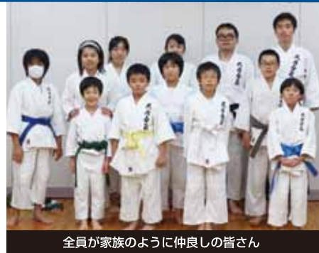
全員が家族のように仲良しの皆さん

いかがですか?親子でOK、高齢者もOKの健康合気道を一度のぞいてみませんか。子供たちの元気な稽古を観ているだけでも、活気が伝わってきて楽しいですよ。