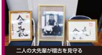
二人の大先輩が稽古を見守る