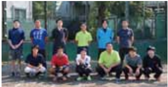
午前戦優勝の「四中先生」チーム

卓球大会と同じ10月9日、四中のグラウンドでは7チームが集結し、熱戦を繰り広げました。今年は午前と午後に分けて試合を行い、それぞれで優勝チームを決める新システムでした。午前の優勝はホームグラウンドの「四中先生」チームが制し、午後の部は「野方スピリッツ」チームが優勝に輝きました。今回「美鳩小おやじの会」が初出場しました。今後の様々な活躍を期待したいですね。