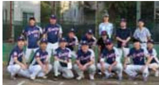
午後戦優勝の「野方スピリッツ」チーム