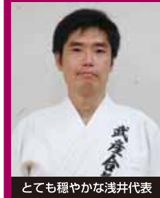
とても穏やかな浅井代表