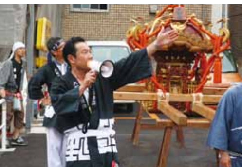
神輿の先頭で進行誘導をされていました