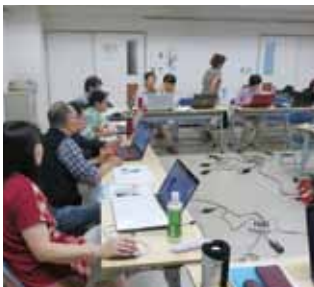
笑い声が絶えない楽しい教室です

★「集会室抽選会」は、毎月第3月曜日(祝日の場合は翌営業日)に翌々月分を抽選で決定します。