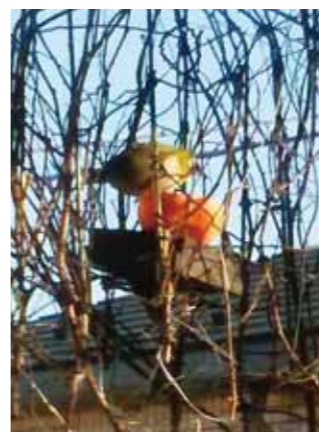
ヒヨドリ除けのエサ台でミカンを食べるメジロ