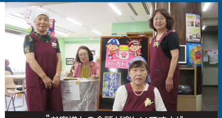
“お客様との会話が楽しいですよ!”

お問合せは、運営委員会までお願いします。(N) が発足当時から殆ど変わってなく、中野区内で独自に運営している地域のコミュニティカフェは「カフェカトリア」だけだそうです。スタッフの方々は「人の役に立てるのが嬉しい。皆様には、気軽にお友達作りや情報交換の場として、利用していただきたい」とおっしゃり、いつも優しい笑顔で接客されています。 カフェのメニューは、コーヒーか紅茶(ポット)にお菓子がついて200円です。お菓子は地域を応援するため、洋菓子は中野区障害者就労施設から焼き菓子を、和菓子は地元のお店から取り寄せています。季節ごとにイベント(節分の豆まき・心な祭り・こどもの日・七夕・ハロウィン・クリスマスなど)も実施し、お客様も楽しみにしています。さて、今年の11月は3周年になることを祝い、感謝をこめて記念祭を企画しているそうです。こんなに地域の皆様に愛されている「カフェカトリア」で、一緒にスタッフとして参加しませんか?ご希望の方、お待ちしています。