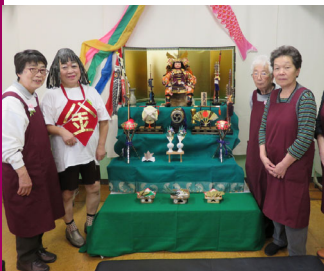
▲5月のイベント「端午の節句」

お問合せは、運営委員会までお願いします。(N) が発足当時から殆ど変わってなく、中野区内で独自に運営している地域のコミュニティカフェは「カフェカトリア」だけだそうです。スタッフの方々は「人の役に立てるのが嬉しい。皆様には、気軽にお友達作りや情報交換の場として、利用していただきたい」とおっしゃり、いつも優しい笑顔で接客されています。 カフェのメニューは、コーヒーか紅茶(ポット)にお菓子がついて200円です。お菓子は地域を応援するため、洋菓子は中野区障害者就労施設から焼き菓子を、和菓子は地元のお店から取り寄せています。季節ごとにイベント(節分の豆まき・心な祭り・こどもの日・七夕・ハロウィン・クリスマスなど)も実施し、お客様も楽しみにしています。さて、今年の11月は3周年になることを祝い、感謝をこめて記念祭を企画しているそうです。こんなに地域の皆様に愛されている「カフェカトリア」で、一緒にスタッフとして参加しませんか?ご希望の方、お待ちしています。